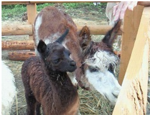
赤ちゃんと母親のドリー

昨年11月に、アメリカコロラド州から山古志油夫集落にやってきて、集落の皆さんによって飼育されている6頭のアルパカ。すでに山古志の